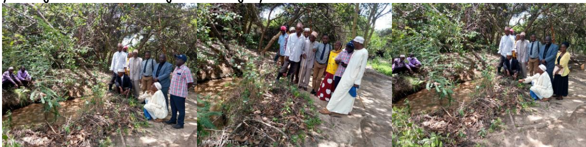
Picha ikionesha watalii wa ndani katika chemchem ya maji

Kwa historia ya wazawa walitumia kutambua mtu mchawi katika jamii yao kwa kutumia chemchem hiyo. Mtu hutumbukizwa katika maji ya chemche na kama ni mtu safi chemchem ina tulia bila kufanya kitu chochote. Kama mtu ni mchawi akitumbukiwa katika maji kwenye chemchem ; Chemchem humtapika/kumtupa nje ya maji kwa kumrusha juu hadi nje ya chemchem.