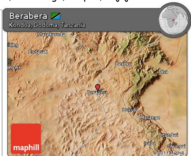
Ramani ikionesha mahali kijiji cha Berabera kilipo na mwonekano wa ardhi