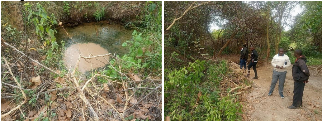
Mtaalamu toka Tume ya Matumizi Bora ya Ardhi Taifa akipata maelezo toka kwa mwenyekiti wa kitongoji juu ya chemchem.

Maji yanayotoka katika chemchem hii, niyamoto na wakati wa asubuhi unaweza teka na kuoga bila shida yoyote. Wenyeji hujipatia maji kwaajili ya matumizi ya nyumbani na mifugo.