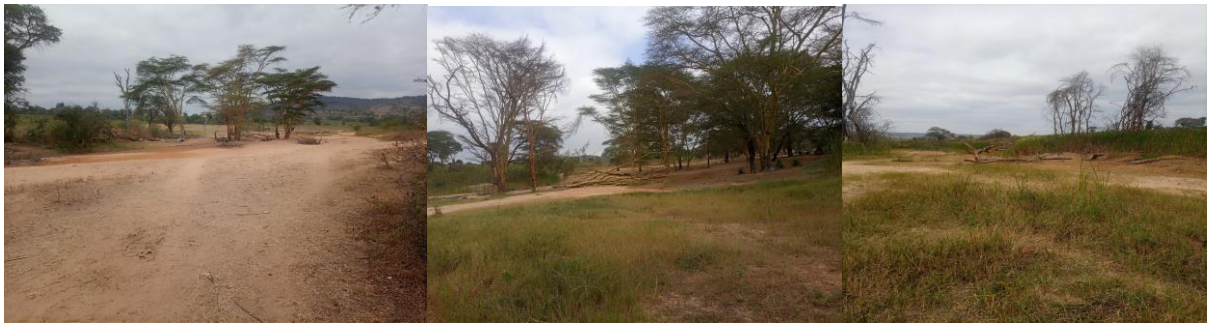
Picha zikionesha mmomonyoko wa ardhi