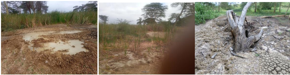
Picha zikionesha lava (Tope katika chemchem)